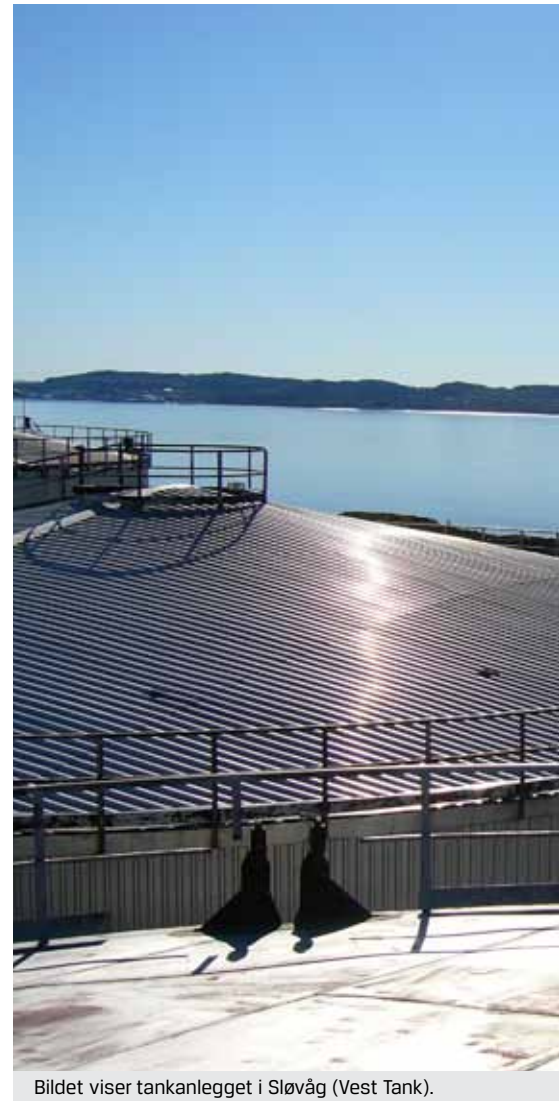
Bildet viser tankanlegget i Sløvåg (Vest Tank).

Selskapsrettslige momenter. Styreleders ansvar kan også utledes av aksjeselskapsretten, der det bl.a. følger av aksjeloven §§ 6-12 og 6-13 at styret skal sørge for en forsvarlig organisering av virksomheten og ha ansvar for å holde tilsyn med den daglige ledelsen og selskapets virksomhet for øvrig. Styret vil etter disse reglene ha et ansvar for å sørge for at selskapets forpliktelser overholdes. Ved utføring av konkrete oppgaver som hører under den daglige ledelsen eller som er delegert videre nedover i systemet, vil styreleders ansvar eventuelt kunne følge av at det ikke er sørget for å gi tilstrekkelig klar instruks eller veiledning for gjennomføringen, at det ikke er valgt kompetente personer, eller