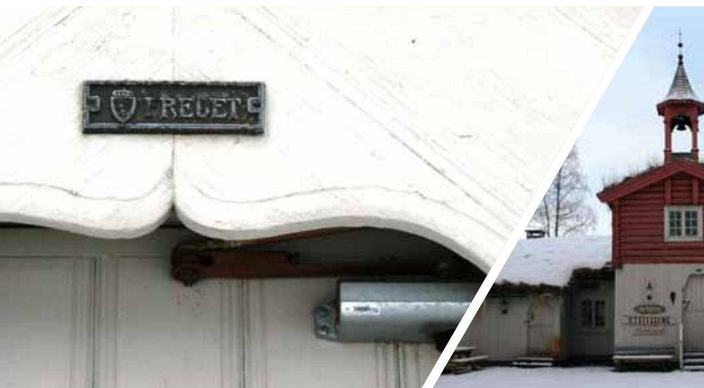
Til venstre: Fredningsskilt, barfrøstua på Koppang. Til høyre: Bilde av Barfrøstua utenfor.

Lagmannsretten uttalte i dommen at man legger straffenivået i Rt 2005.76 til grunn og ga ikke aktor medhold i at straffenivået på miljøområdet er skjerpet siden den gang. ØKOKRIM er ikke enig i lagmannsrettens vurderinger av dette. ØKOKRIM er også uenig i rettsanvendelsen til lagmannsrettens flertall når det gjelder medvirkning til jaging av bjørnen for personen som kjørte bilen. Etter en totalvurdering har ØKOKRIM likevel ikke funnet det hensiktsmessig å anke dommen, blant annet på grunn av de spesielle omstendighetene som knytter seg til personen som kjørte bilen og det at eieren av hunden kun var dømt for jaging av bjørnen etter en bestemmelse i viltloven som ikke er videreført i naturmangfoldloven.