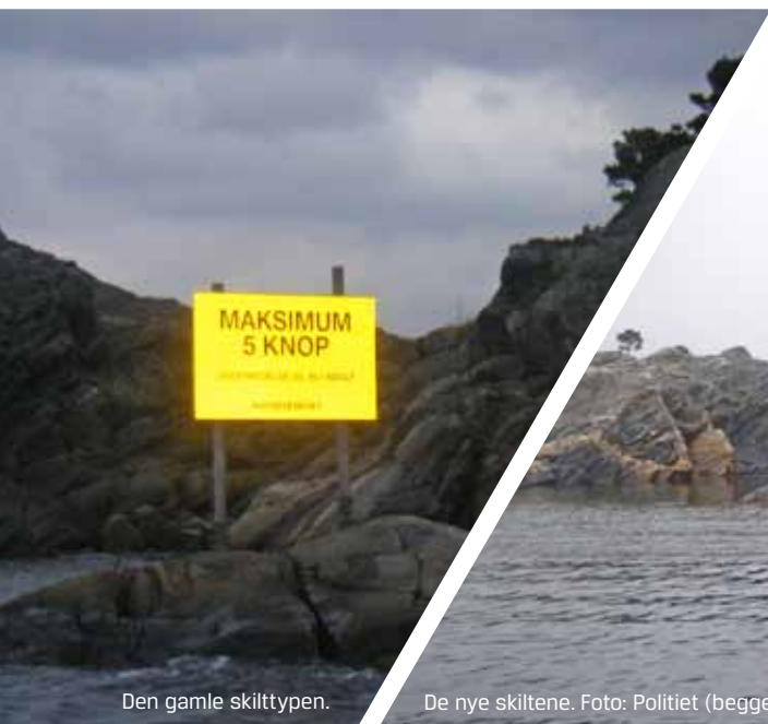
Den gamle skilttypen.

Straffen ble satt til 2.400 kroner i bot, subsidiært fengsel i 5 dager, i tråd med aktors påstand.