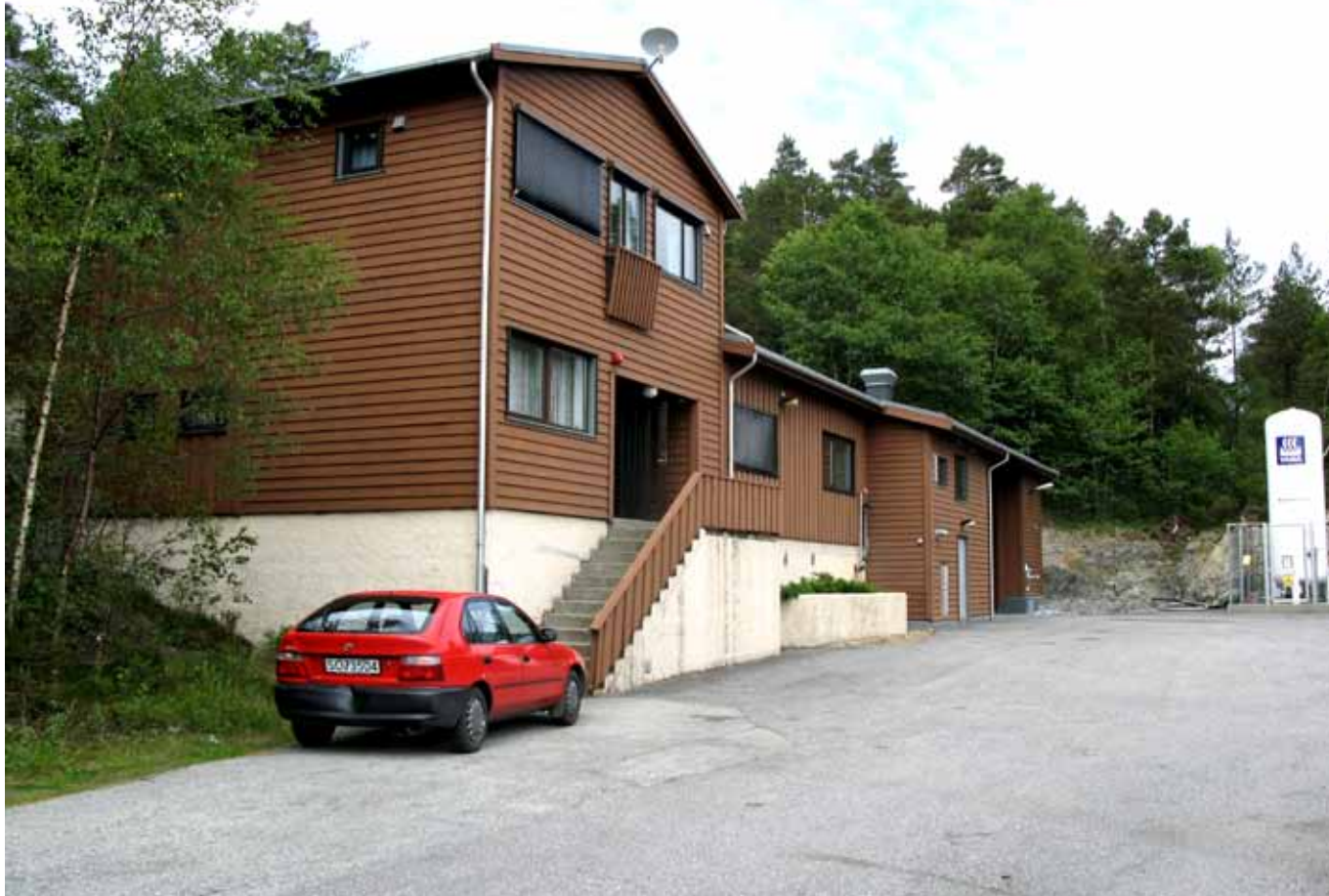
Vannrenseanlegget hvor luttilsettingen gikk galt.