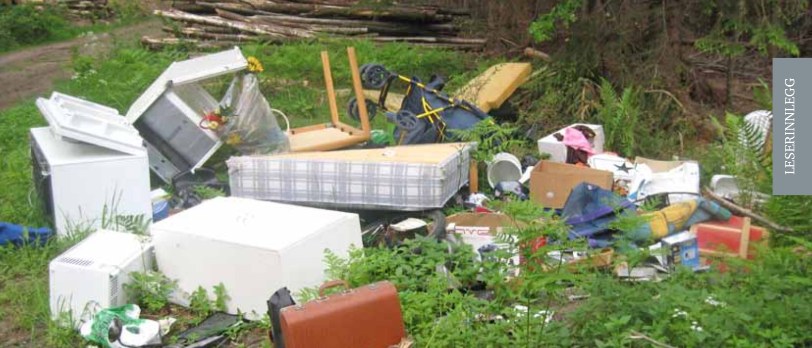
Hvis det ikke reageres med hurtig opprydding og andre tiltak, kan snart forsøplingen innebære en kraftig forringelse av naturen.