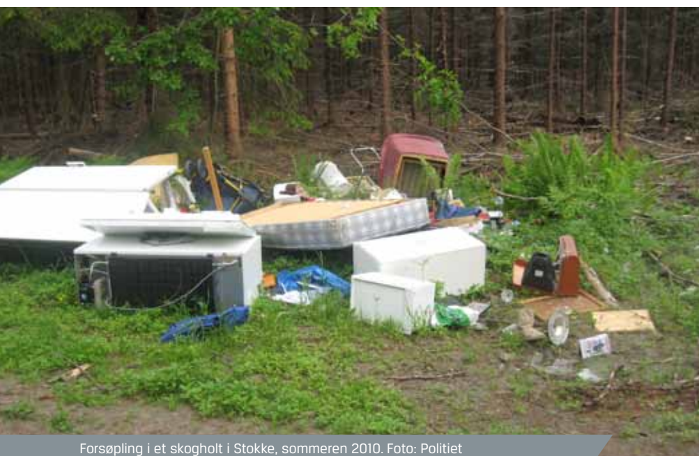
Forsøpling i et skogholt i Stokke, sommeren 2010.

Dette er alt for tafatt holdning! Avfall i slike