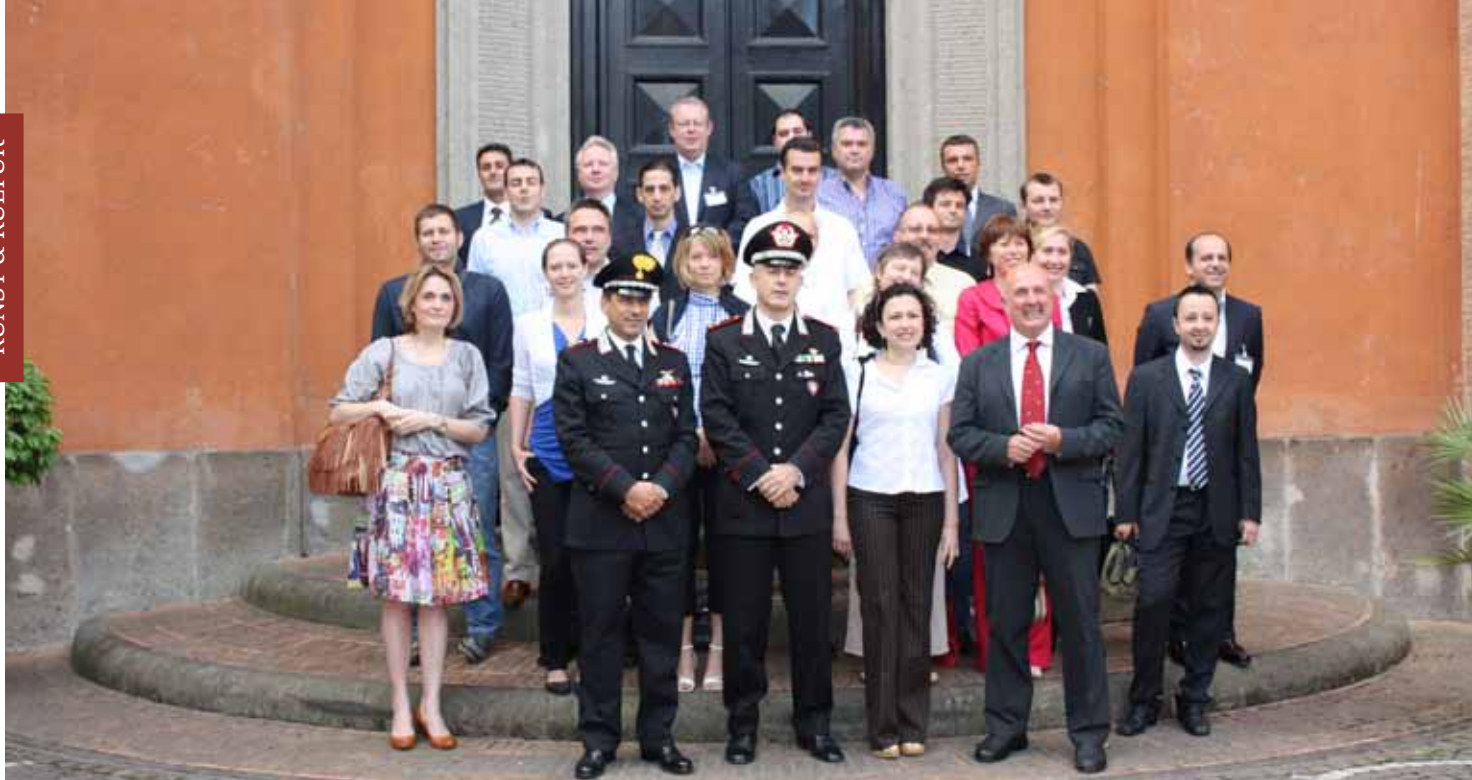
Mange europeiske land delte sine erfaringer på CEPOLs kurs om kulturkriminalitet.

den er således ofte ikke-eksisterende i mange land. Enten så har de ikke inngått internasjonale avtaler, eller så har de ikke implementert avtalen i sitt regelverk.