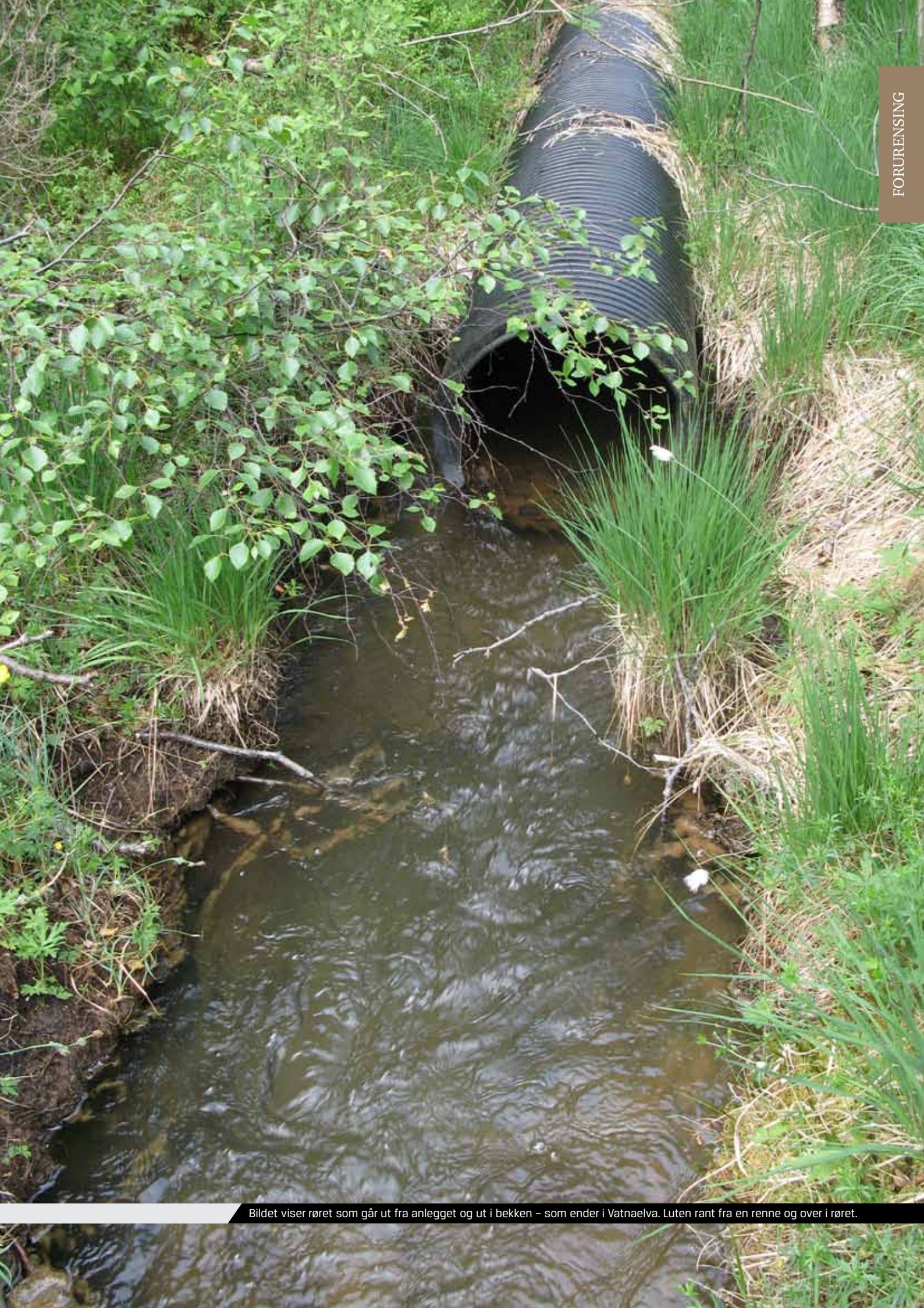
Bildet viser røret som går ut fra anlegget og ut i bekken – som ender i Vatnaelva. Luten rant fra en renne og over i røret.