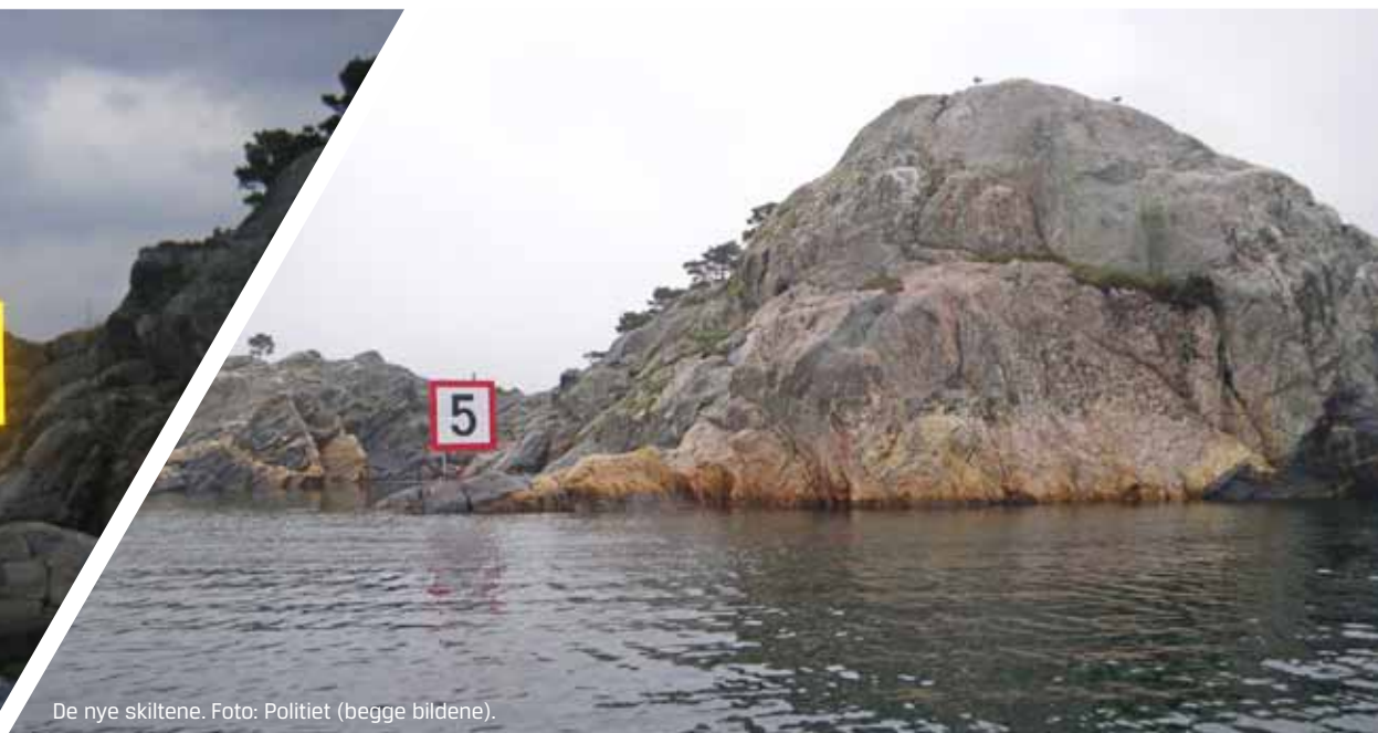
De nye skiltene.